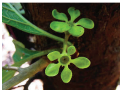
(k) Dioecrescis erythroclada