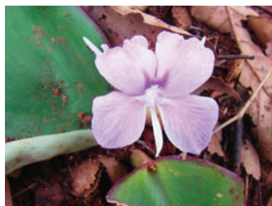
(h) Kaempferia marginata