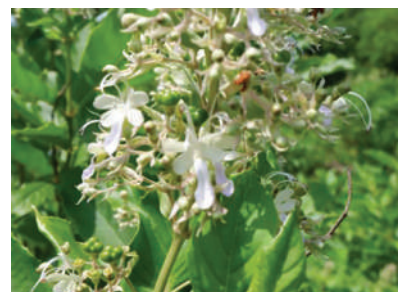
(i) Rothea serrata