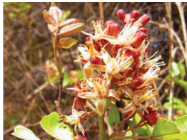
(e) Harrisonia perforata