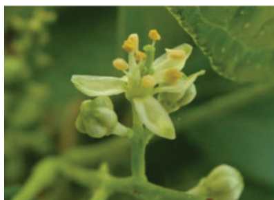
(j) Clausena wallichii var. guillauminii