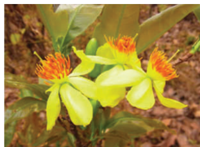
(g) Ochna integerrima