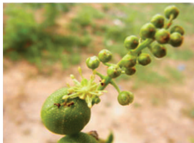
(a) Croton oblongifolius

พื้นที่ป่าชุมชนผาดำลักษณะป่าเป็นป่าเต็งรัง ล้อมรอบด้วยพื้นที่การเกษตรของชาวบ้าน มีสถานที่ปฏิบัติธรรมและวัด ในพื้นที่ป่า นอกจากนี้ยังได้รับงบประมาณสนับสนุนให้วัดถ้ำผาดำเป็นสถานที่ท่องเที่ยวเชิงนิเวศ ควบคู่กับการอนุรักษ์ฟื้นฟูสภาพแวดล้อม ป่าชุมชนผาดำเป็นพื้นที่หลักของชาวบ้านที่