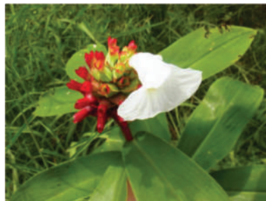
(b) Cheilocostus speciosus