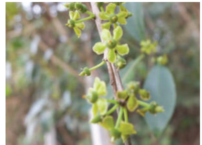
(f) Salacia chinensis