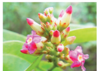
(l) Urceola polymorpha