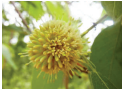
(d) Mitragyna hirsuta