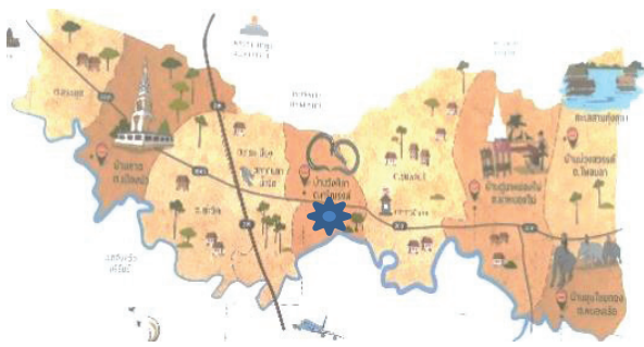
Figure 1 Map and location of eel's habitats (*)

เพื่อศึกษาผลของอาหารที่มีต่อสมบัติทางกายภาพของบ่อเลี้ยงและการเจริญเติบโตของปลาไหลในบ่อซีเมนต์