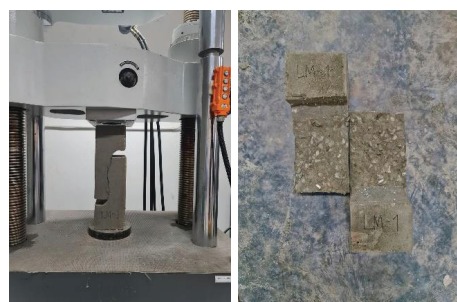
(b) LM Sample failure