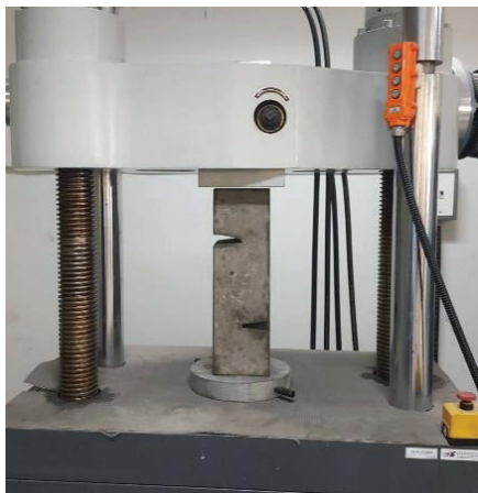
(b) Direct shear test on UTM