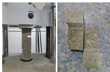
(a) GV Sample failure