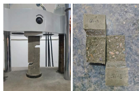
(a) GV Sample failure