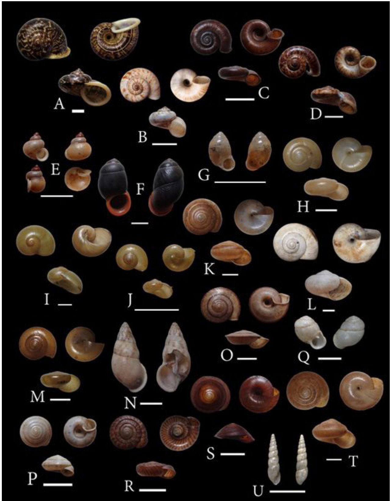
Figure 4 A = Cyclophorus sp., B = Cyclotus sp.1, C = Cyclotus sp.2, D = Rhiostoma housei , E = Dioryx sp., F = Pollicaria myersii , G = Pupina sp., H = Aenigmatoconcha clivicola , I = Megaustenia siamensis , J = Durgella sp., K = Cryptozona siamensis , L = Hemiplecta distincta , M = Sarika sp., N = Amphidromus (Syndromus) sp., O = Landouria sp.1, P = Landouria sp.2, Q = Haploptychius sp., R = Plectopylis sp., S = Trochomorpha sp., T = Phuphania costata , U = Prosopeas sp. (Scale bars = 1 cm)