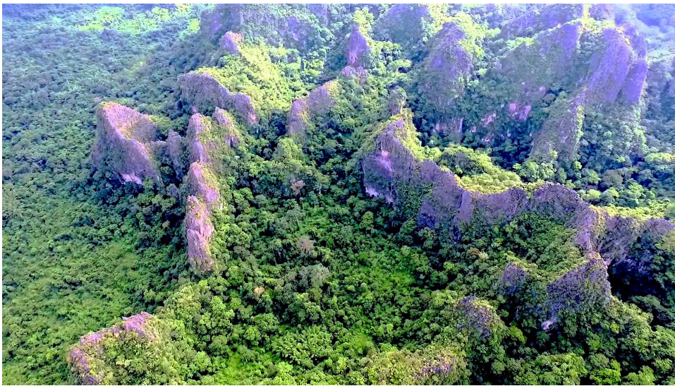
Figure 1 Karst topography provides many habitat types for land snails ( http://laurenleeclimbing.com )

วิเคราะห์ดัชนีความหลากหลายชนิด (species diversity index) โดยใช้ Shannon-Wiener Index 32 : H = -\sum (pi)(\ln pi) และดัชนีความเด่น (dominance species index) 32 : C = \sum(pi)^2 วิเคราะห์ค่าสัมประสิทธิ์ความคล้ายคลึงของชนิดของหอยทากบกที่พบในพื้นที่สำรวจตัวอย่างทั้ง 9 แห่ง โดยใช้ Sorensen's similarity coefficient 32 : S_s = 2a / 2a+b+c ทำ cluster analysis แสดงผลเป็นเดนไดรแกรม PC-ORD 5.10