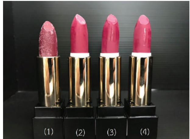
Figure 2 Lipstick

จากทดลองสกัดสีจากใบประดับเฟื่องฟ้าสีม่วงแดง พบว่าสภาวะที่เหมาะสมในการสกัดสีให้ได้ปริมาณเบต้าไซยานินมากที่สุด คือ การสกัดที่อัตราส่วนใบประดับเฟื่องฟ้าแห้งต่อสารละลายเอทานอลความเข้มข้นร้อยละ 50 โดยปริมาตร เท่ากับ 1:30 (g/mL) และระยะเวลาในการสกัดสี 30 นาที พบเบต้าไซยานินมากที่สุด สภาวะในการสกัดสีจากใบประดับเฟื่องฟ้าดังกล่าวจึงถูกนำมาเตรียมสีเลค โดยผลการเตรียมด้วยเกลือต่างๆ พบว่าเกลือที่เหมาะสมที่สุดในการทดลองนี้ คือ อะลูมิเนียมคลอไรด์ ซึ่งให้สีม่วงแดงเข้ม จึงทำสีเลคที่เตรียมด้วยอะลูมิเนียมคลอไรด์ มาศึกษาต่อเพียงตัวอย่างเดียว โดยนำสีเลคที่ได้ไปวัดด้วยเครื่องวัดสี ซึ่งผลการทดลองเป็นไปดังนี้ ค่าความสว่าง-ความมืดเฉลี่ย ค่าความแดง-เขียวเฉลี่ย และ ค่าความเหลือง-ความน้ำเงินเฉลี่ย มีค่าเท่ากับ 37.51 (±1.62), 10.23 (±0.12) และ 12.65 (±0.22) ตามลำดับ นอกจากนี้เมื่อนำสารสีเลคที่ได้ไปวิเคราะห์โดยเครื่องฟูเรียร์ทรานส์ฟอร์ม อินฟราเรดสเปกโตรมิเตอร์ ยังพบว่ามีหมู่คาร์บอนิลในโครงสร้างเพราะการปรากฏของพีคที่เลขคลื่น 1624.38 \text{cm}^{-1} และจากการพัฒนาผลิตภัณฑ์เครื่องสำอางที่มีสีเลคจากใบประดับเฟื่องฟ้า พบว่าค่าความแดงยิ่งลดลงเมื่อมีการเติมสีเลคมากขึ้น โดยสูตรที่มีความแตกต่างของสีน้อยที่สุดเมื่อเทียบกับสูตรต้นแบบ (สูตรที่ 1) คือ สูตรที่ 2 ( \Delta E=1.24 ) และจากผลการทดสอบจุดหลอมเหลวที่เปรียบเทียบระหว่างสูตรที่มีสีเลค พบว่ายิ่งความเข้มข้นของสีเลคใบประดับเฟื่องฟ้ามาก ยิ่งมีจุดหลอมเหลวสูง