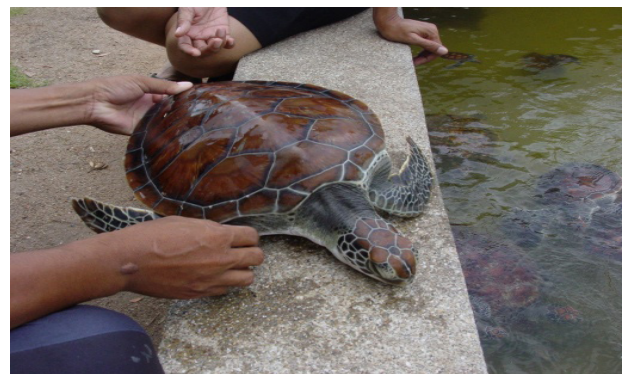
Figure 1 Marine turtle ( Chelonia mydas , Linnaeus 1758)

การศึกษาในครั้งนี้ได้วางแผนการทดลองแบบสุ่มสมบูรณ์ (Completely randomized design) เพื่อศึกษาความแตกต่างของแบคทีเรียในน้ำทะเลที่นำมาใช้เพาะเลี้ยงเต่าทะเลในช่วงระยะเวลา 5 เดือน ตั้งแต่ตุลาคม พ.ศ. 2548 ถึงกุมภาพันธ์ พ.ศ. 2549 โดยเก็บตัวอย่างน้ำทะเลจากบริเวณสถานีอนุรักษ์พันธุ์เต่าทะเลศรีราชา จังหวัดชลบุรี ซึ่งเป็นน้ำก่อนนำมาใส่ในบ่อเลี้ยงเต่าทะเล โดยเก็บตัวอย่างน้ำทะเลจำนวน 1 จุด ที่ระดับความลึกของน้ำ 3-5 เซนติเมตร ห่างจากชายฝั่ง 30 เซนติเมตร (Figure 2) เดือนละ 1 ครั้ง (จำนวน 3 ครั้ง) และนำมาตรวจวิเคราะห์หาปริมาณและชนิดของแบคทีเรียทั้งหมดต่อไป