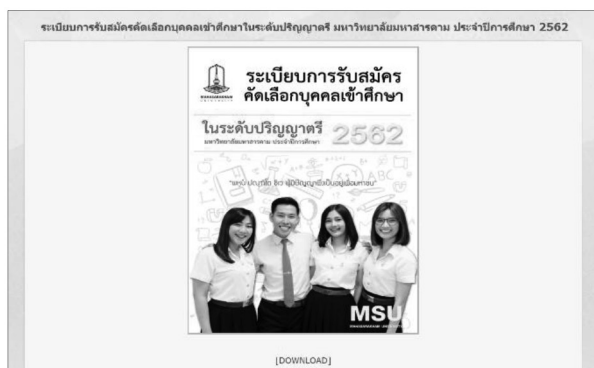
Figure 5 Original System

จากระบบการประชาสัมพันธ์ข้อมูลหลักสูตรแบบเดิม โดยการประชาสัมพันธ์ผ่านเว็บไซต์ ของข้อมูลหลักสูตรของคณะต่างๆ เป็นไฟล์ Portable Document Format : PDF ซึ่งเป็นรูปเล่มระเบียบการประชาสัมพันธ์ข้อเสียของรูปแบบเดิมคือมีข้อมูลที่มากเกินไปและไม่เป็นสัดส่วนของข้อมูลหลักสูตรการประชาสัมพันธ์แบบเดิมมีรายละเอียดดัง Figure 5