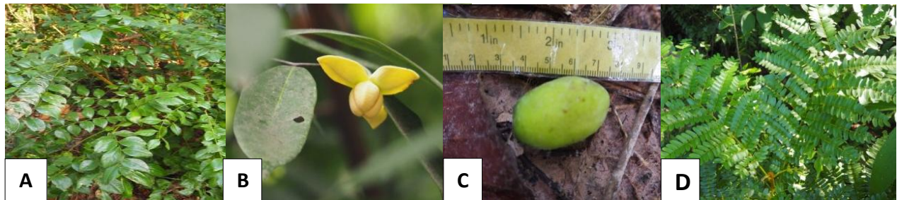
Figure 2 The importance value index (IVI) of medicinal plants in Khok Khu Khat - Ban Khu Si Chae community forest (A) Erythrophleum succirubrum Gagnep. (B) Melodorum fruticosum Lour. (C) Canarium subulatum Guill. (D) Peltophorum dasyrachis (Miq.) Kurz.

สำคัญเท่ากับ 0.27 ตามลำดับ และฤดูฝน พรรณไม้เด่นที่มีค่าดัชนีความสำคัญมากที่สุดคือ พันชาติ Erythrophleum succirubrum Gagnep.) รองลงมาคือ ลำตวน ( Melodorum fruticosum Lour.) มะกอกเกลื้อน ( Canarium subulatum Guill.) และอะราง ( Peltophorum dasyrachis (Miq.) Kurz.) ตามลำดับ เช่นเดียวกับกับฤดูแล้ง โดยมีค่าดัชนีความสำคัญเท่ากับ 25.08, 24.78, 21.59 และ 14.86 ตามลำดับ ส่วนพรรณไม้ที่ค่าดัชนีความสำคัญน้อยที่สุดคือข่าป่า ( Alpinia malaccensis (Burm. f.) Roscoe.) บุกคางคก ( Amorphophallus paeoniifolius (Dennst.) Nicolson) มะม่วงป่า ( Mangifera coloneura Kurz.) มะลิป่า ( Jasminum nervosum Lour.) ซึ่งมีค่าดัชนีความสำคัญเท่ากับ 0.25 (Figure 2 และ Table 3)