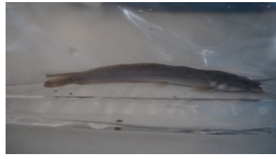
Figure 2 Anesthesia of Hybrid catfish receiving clove callus extract (5 ppm) to stimulate in sedation

ผลการทดสอบฤทธิ์ของสารสกัดแคลลัสจากผลต่อการสงบนิ่งปลาดุกอุยเทศที่ความเข้มข้นระดับต่าง ๆ เปรียบเทียบกับกลุ่มควบคุมใช้เอทานอล 50 เปอร์เซ็นต์ ผลการทดสอบ พบว่าสารสกัดแคลลัสจากผลที่ระดับความเข้มข้น 1, 2, 3, 4 และ 5 ppm และสาร MS-222 ความเข้มข้น 10 ppm มีฤทธิ์ต่อการสงบนิ่งของปลาดุกอุยเทศขนาด 10-15 เซนติเมตร น้ำหนัก 10-15 กรัม อายุประมาณ 3 เดือน (Figure 2 และ Table 3) โดยปลาเข้าสู่ระดับอาการเคลื่อนไหวช้าใช้เวลา 7.13, 5.35, 2.74, 1.87, 0.99 และ 5.02 นาที ตามลำดับ เข้าสู่ระดับอาการสงบนิ่งใช้เวลา 7.61, 6.21, 3.74, 2.72, 1.28 และ 18.94 นาที ตามลำดับ และเข้าสู่ระดับอาการสงบนิ่งได้นาน 51.70, 53.14, 55.51, 56.50, 57.68 และ 39.00 นาที ตามลำดับ