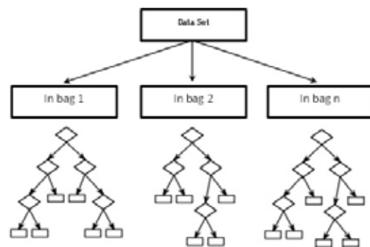
Figure 1 Characteristics of Random Forest

2) เทคนิค Random Forest 9 เป็นเทคนิคการสุ่มเลือกใช้ข้อมูลและคุณลักษณะ Decision Tree ซึ่งถูกสร้างจากการนำข้อมูลไปสุ่มเลือกตัวอย่างแบบเลือกแล้วใส่กลับ (Sampling with Replacement) แล้วนำมาสร้างเป็น Tree ซึ่งจะมีตัวอย่างส่วนหนึ่งที่ไม่ถูกเลือก ซึ่งข้อมูลส่วนนี้เรียกว่า Out-of-Bag (OOB) จะถูกนำมาใช้ในการทดสอบ Decision Tree วิธีการดังกล่าวนี้เรียกว่า Bagging ผลลัพธ์ที่ได้จากอิสระจาก Decision Tree ในแต่ละต้นถูกนำมาคิดเป็นผลการโหวต ผลโหวตที่มากที่สุดจะใช้ระบุสถานะของคลาสดัง Figure 1 เทคนิค Random Forest ไม่จำเป็นต้องมีข้อมูลทดสอบ เพื่อประมาณความผิดพลาดเพราะข้อมูล OOB นั้นถูก นำมาใช้ทดสอบ Decision Tree นั้นแล้ว