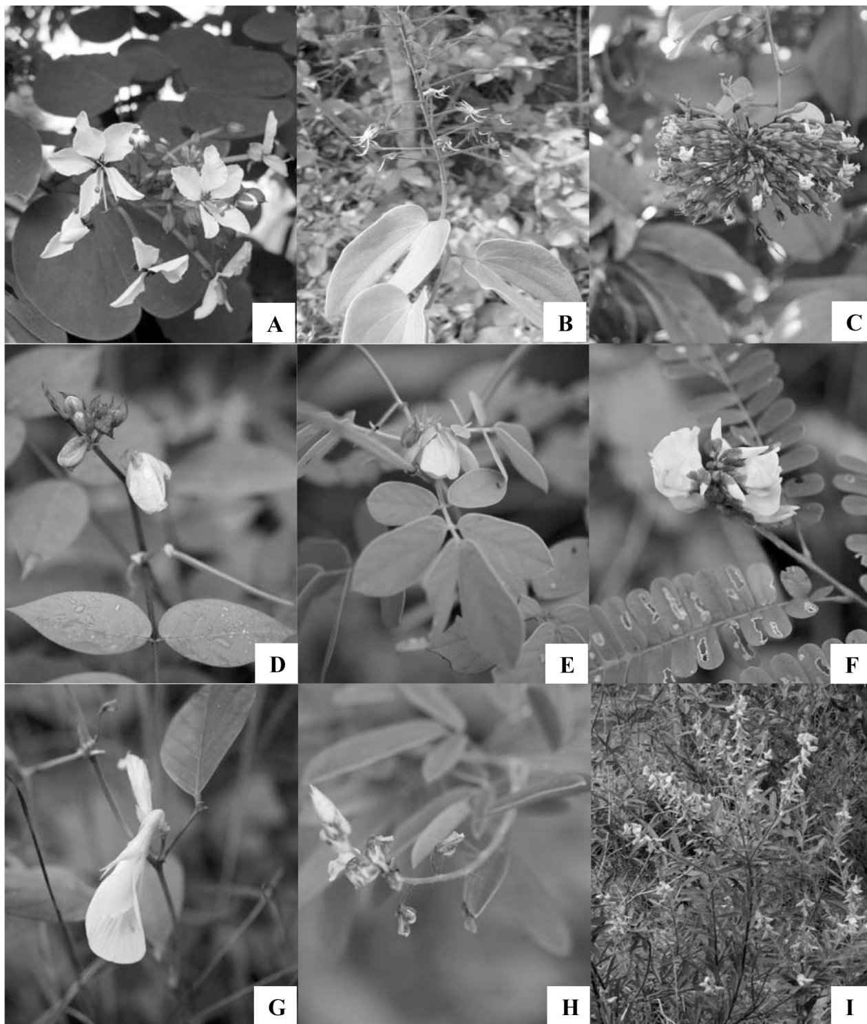
Figure 1 Leguminous plants found in Phu Langka National Park (A) Bauhinia lakhonensis Gagnep. (B) B. penicilliloba Pierre ex Gagnep. (C) B. sirindhorniae K.Larsen & S.S.Larsen (D) Senna occidentalis (L.) Link (E) S. tora (L.) Roxb. (F) Abrus pulchellus Wallich ex Thwaites (G) Clitoria macrophylla Wall., (H) Codario-calyx motorius (Houtt.) H. Ohashi (I) Crotalaria kostermansii Niyomdham