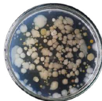
Figure 1 Characteristics of isolated bacterial colonies on CMC Agar