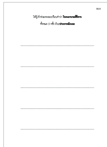
Figure 2 Sample images of the first sheet of each set.

การเตรียมกระดาษรอง ผู้วิจัยเตรียมกระดาษทั้งสิ้น 30 ชุด แบ่งเป็นกระดาษเอกสารขนาด 70 แกรม 10 ชุด กระดาษเอกสารขนาด 80 แกรม 10 ชุด และกระดาษรายงานขนาด 70 แกรม 10 ชุด นำกระดาษเอกสารขนาด 70 และ 80 แกรม และกระดาษรายงานขนาด 70 แกรม แต่ละขนาดเลือกมา 6 แผ่นและเย็บรวมกันด้วยเครื่องเย็บกระดาษที่มุมขวาของกระดาษ โดยก่อนจะทำการเย็บ ผู้วิจัยจะนำกระดาษแผ่นบนสุดที่ทำหน้าที่เป็นกระดาษสำหรับเขียนนั้นไปพิมพ์ข้อความและแนวเส้นบรรทัดเพื่อให้ผู้เข้าร่วมทดลองได้เขียนในจุดที่กำหนดในลักษณะเดียวกัน (Figure 2) ซึ่งผู้ร่วมการทดลองจะเขียนชื่อตนเองที่กระดาษแผ่นแรกของแต่ละชุด ชุดละ 5 ครั้ง ดังนั้นเมื่อสิ้นสุดการเขียนผู้เข้าร่วมการทดลองจะได้เขียนชื่อตนเองทั้งสิ้น 30 ครั้ง แบ่งเป็นการเขียนด้วยปากกาลูกลื่น 15 ครั้ง และการเขียนด้วยปากกาหมึกเจล 15 ครั้ง