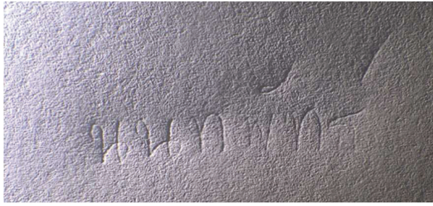
Figure 3 Image of the 1st paper backing using oblique light shining to the left, height 10 mm.