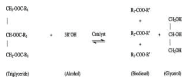
Figure 1 Transesterification reaction

ไบโอดีเซล (Biodiesel) เป็นน้ำมันเชื้อเพลิงทางเลือกที่ผลิตได้จากน้ำมันพืชหรือไขมันสัตว์ผ่านปฏิกิริยาเคมีที่เรียกว่า “ทรานส์เอสเทอร์ฟิเคชัน” ซึ่งเป็นการทำปฏิกิริยากับแอลกอฮอล์ โดยมีตัวเร่งปฏิกิริยาและอุณหภูมิที่เหมาะสม ได้ผลผลิตหลักออกมาเป็น “แอลคิลเอสเทอร์ (ไบโอดีเซล)” และได้กลีเซอรอลเป็นผลพลอยได้ (สุหรีต นิเช็ง, 2563) โดยในทางทฤษฎีอัตราส่วนโดยโมลระหว่างเมทานอลต่อน้ำมันคือ 3:1 (Figure 1)