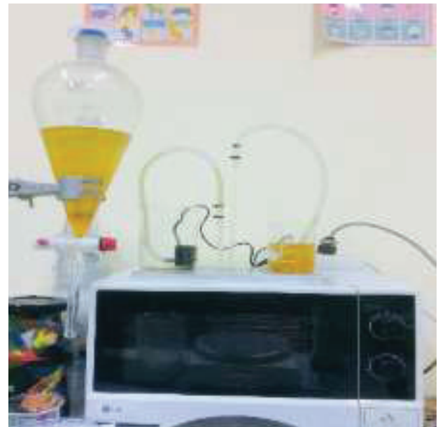
Figure 3 Biodiesel production process

5. ทำการทดลองซ้ำตามการออกแบบการทดลอง ใน Table 4 โดยทำการทดลองสภาวะละ 2 ซ้ำ