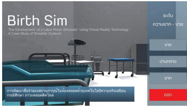
Figure 1 Difficulty level selection menu

เมื่อเข้าสู่การจำลองสถานการณ์ ผู้เรียนจะได้รับบทบาทเป็นพยาบาลวิชาชีพ ที่ต้องทำคลอดในสถานการณ์ภาวะคลอดติดไหล่ โดยมีมุมมองแบบ 3 มิติให้ผู้เรียนมีความรู้สึกเสมือนว่าเป็นตัวละครภายในเนื้อเรื่อง (Identification and