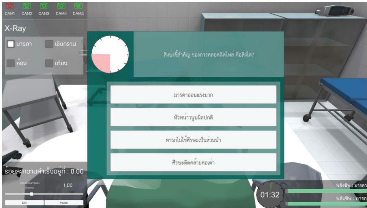
Figure 3 Questions Display in Birthsim

ประเมินความรู้ของผู้เรียน และจะแสดงคำตอบที่ถูกต้องหลัง การเลือกคำตอบแก่ผู้เรียนโดยทันที เพื่อเป็นการทบทวน และเพิ่มพูนความรู้ (Knowledge gain) ตามวัตถุประสงค์ ของการใช้งานเบิรท์ซิม