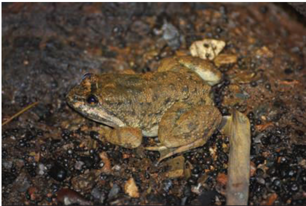
Figure 1 General characteristics of the Limnonectes taylori

กบเป็นสัตว์สะเทินน้ำสะเทินบกที่มีความหลากหลายชนิดมากจัดอยู่ในอันดับกบ (order Anura) วงศ์ Dicoglossidae ทั่วโลกพบกบในวงศ์นี้จำนวน 14 สกุล และประมาณ 215 ชนิด แบ่งออกเป็น 2 วงศ์ย่อย คือ วงศ์ย่อย Dicoglossinae มี 12 สกุล 200 ชนิด และ วงศ์ย่อย Occidozyginae มี 2 สกุล 15 ชนิด กบห้วย ขาป้อมเหนือหรือกบห้วยขาป้อมเทลเลอร์ ( Limnonectes taylori ) อยู่ในวงศ์ย่อย Dicoglossinae สกุลกบล่าห้วย (genus Limnonectes ) ในสกุลนี้มีสมาชิกอยู่ 72 ชนิด 1 สำหรับในประเทศไทยพบ 16 ชนิด 2 กบห้วยขาป้อมเหนือจัดเป็นกบขนาดกลาง มีส่วนหัวค่อนข้างโต เพศผู้มีขนาดลำตัว 46-93 มิลลิเมตร เพศเมียมีขนาด 40-62 มิลลิเมตร เพศผู้มีส่วนหัวยาวกว่าเพศเมีย ลำตัวด้านหลังและขามีแถบสีดำหรือสีเข้ม มีตุ่มขนาดเล็กละเอียดด้านหลัง และมีพังผืดเว้าลึกแต่กางเต็มนิ้วตีน 3 (Figure 1) มีเขตกระจายพันธุ์ทางภาคเหนือของประเทศไทยในพื้นที่จังหวัดเชียงราย เชียงใหม่ แม่ฮ่องสอน ลำปาง แพร่ น่าน และภาคตะวันตกของประเทศไทย ได้แก่ จังหวัดตาก 2