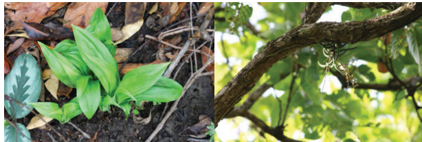
สกุลจุงนาง Geodorum sp.