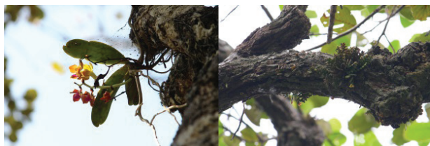
เอื้องลั่นกระบือ Hygrochilus parishii