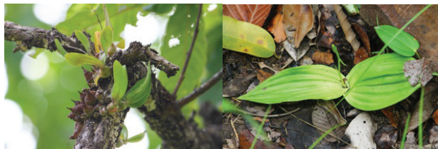
เอื้องดอกมะขาม Dendrobium delacourii

ต้นไม้ที่มีความหลากหลายของชนิดกล้วยไม้อิงอาศัยมากที่สุด คือ เต็ง ( Shorea obtusa Wall. ex Blume) รองลงมา คือ ก่อตลับ ( Quercus ramsbottomii A. Camus) และ ยางเหียง ( Dipterocarpus obtusifolius Teijsm. ex Miq.) โดยช่วงความสูงจากพื้นดินที่กล้วยไม้อิงอาศัยบนต้นไม้ในป่า เต็งรัง ป่าดิบแล้ง และป่าเบญจพรรณ อยู่ที่ 0.5-23, 0.5-18 และ 1.6-20 เมตร ตามลำดับ