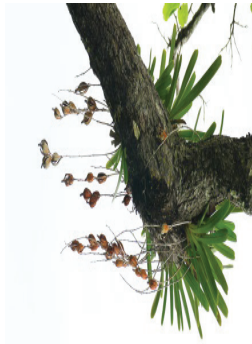
สกุลกะเรกะร้อน Cymbidium sp.