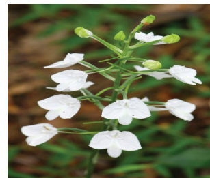
นางตายตัวผู้ Habenaria lindleyana