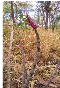
เอื้องแปรงสีฟัน Dendrobium secundum