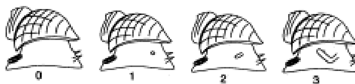
Figure 2 Stages of imposex