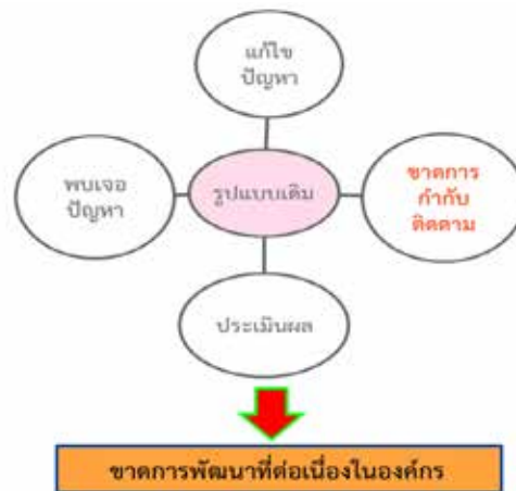
Figure 1 Original Model

เนื่องจากโรงพยาบาลดอนมดแดง ขาดการกำกับ ติดตามอย่างต่อเนื่องทำให้ไม่สามารถดำเนินการต่อเนื่องได้ ดัง (Figure 1)