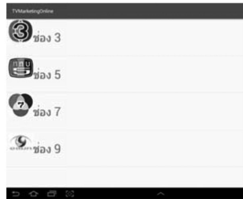
Figure 3 The Main Menu Display of Application

หน้าจอหลักเป็นหน้าจอที่แสดงเมนูรายการโทรทัศน์สำหรับให้ผู้ใช้เลือกรับชมประกอบไปด้วยรูปภาพที่แสดงช่องโทรทัศน์และชื่อสถานีโทรทัศน์ขนาดใหญ่เรียงลำดับหมายเลขช่องจากน้อยไปหามากคือ 3, 5, 7 และ 9 ตามลำดับเพื่อให้ผู้ใช้สามารถเลือกรับชมได้สะดวกหน้าจอหลักแสดงดัง (Figure 3)