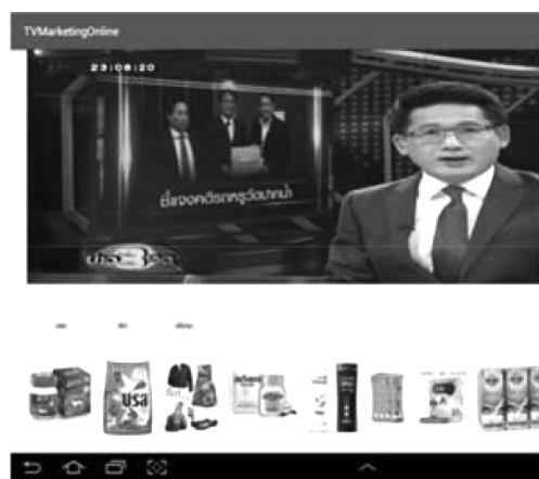
Figure 4 TV Program Displayed with the Product Presentation

หน้าจอรับชมภาพเป็นส่วนหน้าจอแสดงผลเพื่อให้ผู้ใช้สามารถรับชมรายการโทรทัศน์ได้โดยผู้ใช้สามารถเลือกหยุดรับชมชั่วคราวได้ด้วยการเลือกที่ปุ่มพักมีการออกแบบปุ่มเพื่อการเล่นต่อการขยายชมภาพเต็มจอแสดงดัง (Figure 4)