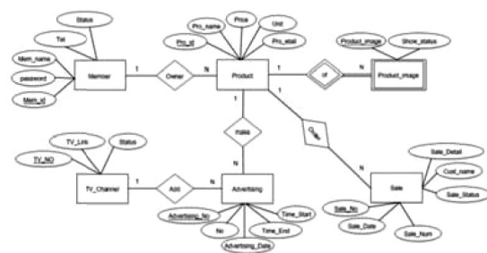
Figure 1 The Database ER-Diagram

ขั้นตอนนี้เป็นขั้นตอนการออกแบบฐานข้อมูลให้รองรับการจัดการข้อมูลของแอปพลิเคชันซึ่งประกอบด้วยข้อมูลช่องทีวีข้อมูลสมาชิกโดยจะแบ่งสถานะออกเป็นผู้ดูแลระบบสมาชิกที่เป็นผู้ขายสมาชิกที่เป็นผู้ฝากขายข้อมูลสินค้าข้อมูลการโฆษณาข้อมูลการขายหรือการสั่งซื้อแผนภาพ ER-Diagram ฐานข้อมูลแสดง (Figure 1)