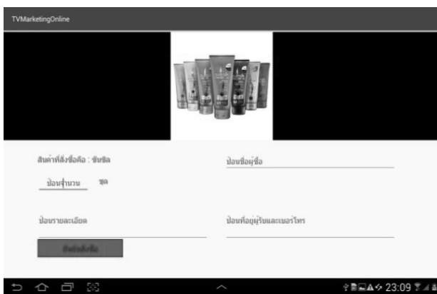
Figure 5 Product Detail Presentation

นอกจากนี้หน้าจอเลือกดูรายละเอียดสินค้าและการสั่งซื้อสินค้าเป็นหน้าจอสำหรับให้ผู้ใช้เลือกดูรายละเอียดสินค้าตามที่ตนสนใจได้โดยการเลื่อนดูรูปภาพสินค้ารวมทั้งผู้ใช้สามารถป้อนข้อมูลเพื่อการสั่งซื้อสินค้าได้ด้วยตัวอย่างการแสดงรายละเอียดสินค้าและสั่งซื้อสินค้าแสดงดัง (Figure 5) และ (Figure 6) ตามลำดับ