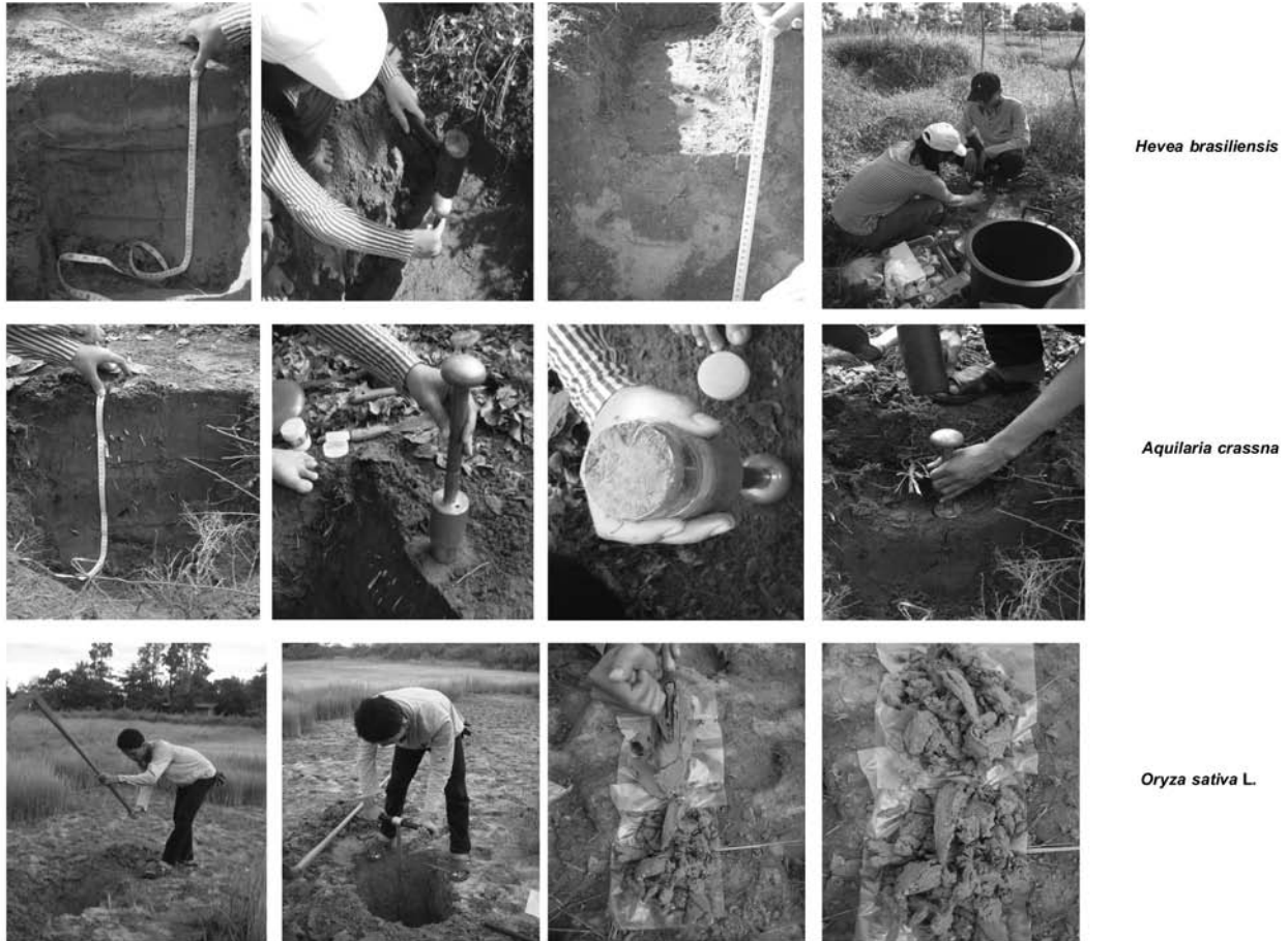
Figure 2 The processes of soil sample collections in the cultivated areas

เป็นดินบน และดินล่าง บริเวณสวนกฤษณา สวนยางพารา และนาข้าว เพื่อนำไปวิเคราะห์ค่า soil organic carbon (SOC), ค่า Organic matter (OM), ค่า Bulk density และธาตุอาหารที่จำเป็นต่อการเจริญเติบโตของพืชในแต่ละการใช้ประโยชน์ที่ดิน (Figure 2)